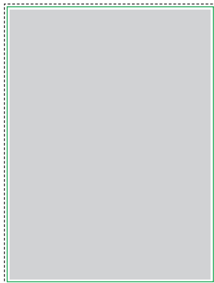
1:10 Vorlage auf Seite 2